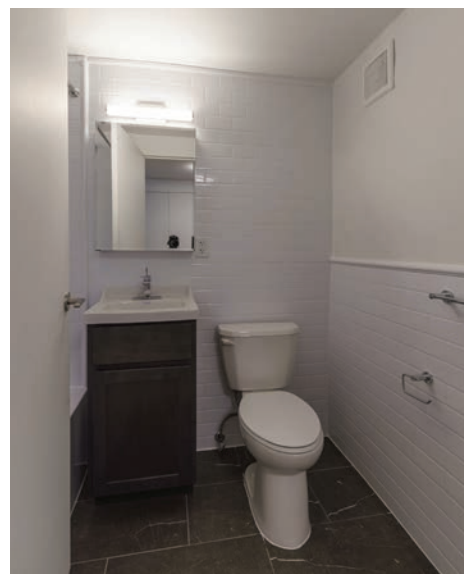
Exemple d'un logement achevé au PACT Brooklyn Bundle II de NYCHA